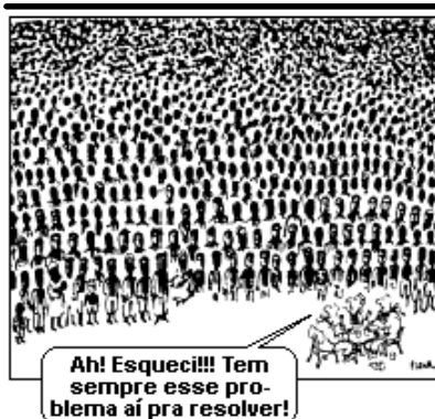
L'État du monde, 1982. In: Edson Alberto Carvalho Feireira. O Mundo contemporâneo. São Paulo: Núcleo, 1986.